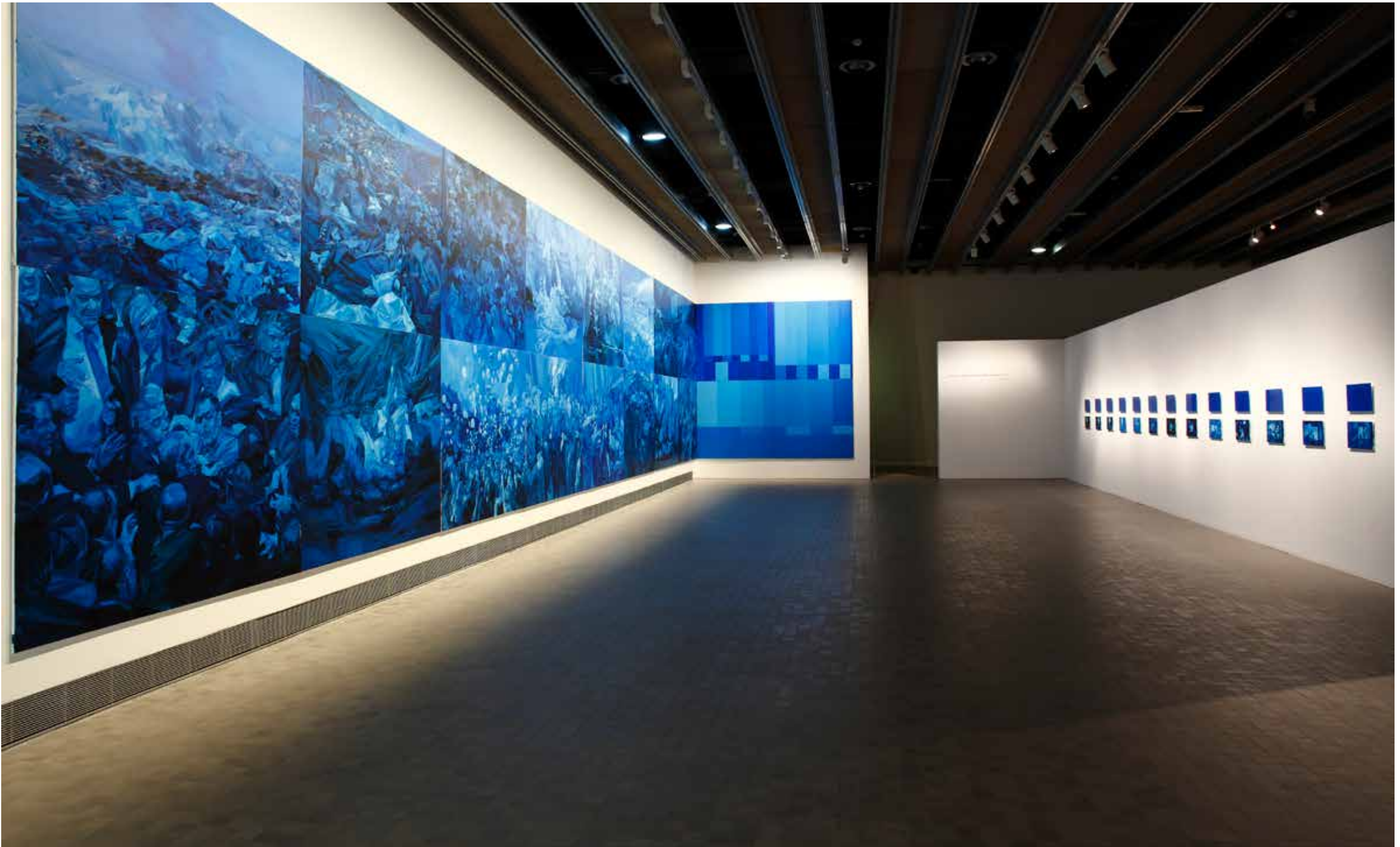
Blua ombro, 2017 Óleo y acrílico sobre lienzo