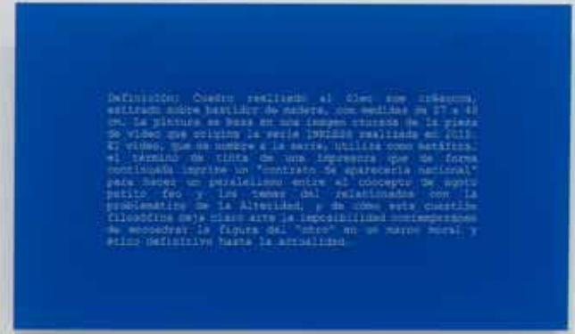
Uno y tres cuadros, 2017 Seis trípticos formados por lienzo, fotografía y metacrilato