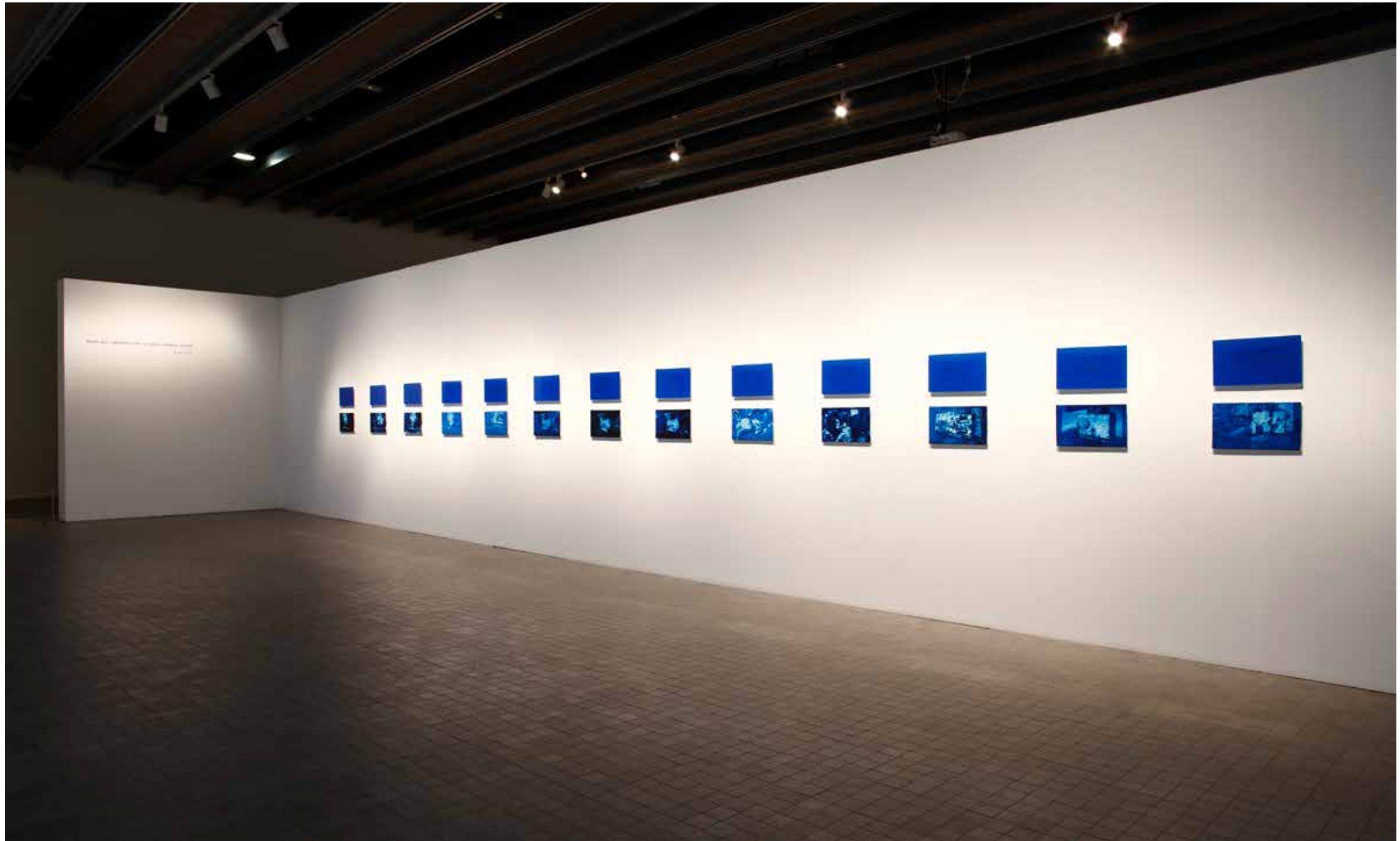
Eso no es una pintura... Lo digo yo , 2017 Trece dipticos compuestos por acrílico sobre lienzo y espejo intervenido pictóricamente