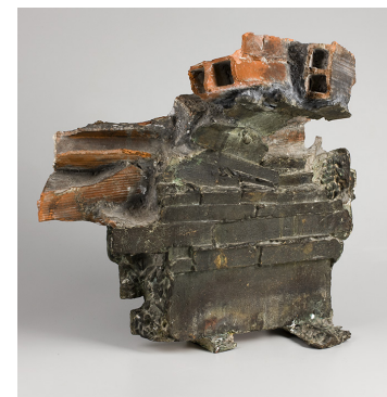
Bóveda para el hombre n°63 , ladrillo, cemento y bronce, 1962. ↗

Realizadas en bronce, escayola y otros materiales, en ellas se refleja la voluntad de mostrarnos el proceso constructor, a través de la huella dejada por la madera, el yeso o el ladrillo, como metáfora de la construcción que cada individuo lleva a cabo en su propio proceso vital. Esta idea la trasladará a tamaño monumental en 1963 con la Gran Bóveda , inserta en una montaña, en la Central Hidroeléctrica del Salto de Aldeadávila (Salamanca).