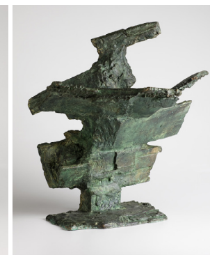
Bóveda para el hombre , bronce, h. 1961. ↗