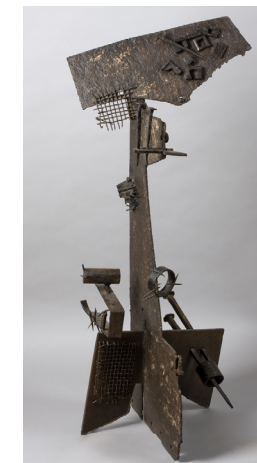
Quijote , hierro soldado, 1957. ↗