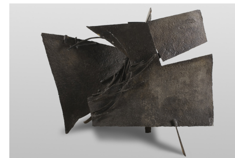
Taurobolo , hierro y chapa soldados, 1958. ↗