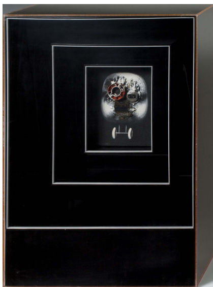
Juana Francés, El hombre y la ciudad , 1970.

En esta exposición cinco mujeres y un hombre nos invitan, a través de sus obras, a recuperar lo pequeño, a descubrir lo que está oculto pese a estar a la vista. Partiendo del dibujo y de la pintura consiguen conquistar el volumen, mostrándonos diversas maneras de sentir y de interpretar nuestro entorno.