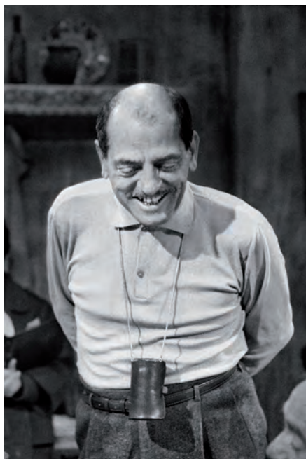
Luis Buñuel en el rodaje de Viridiana , 1961 (2017, primera copia) Luis Buñuel portrayed during Viridiana's filming (first development process in 2017) Fotografía en papel de gelatina de plata Silver gelatine photograph Colección IAACC Pablo Serrano

Luis Buñuel (Calanda [Teruel], 1900 - México, 1983) Perteneciente al círculo de intelectuales que Salvador Dalí y Federico García Lorca conformaron en la Residencia de Estudiantes, Luis Buñuel es uno de los grandes nombres de la historia del cine, como representante del surrealismo con obras como Un perro andaluz , escrita al alimón con Dalí, o La edad de oro . Su carrera de cineasta le llevó a Francia, Estados Unidos y México, desarrollando un cine de cuño propio caracterizado por la crítica social que dejó reflejada en obras como Los olvidados (Premio a la mejor dirección del Festival de Cannes, 1951), Viridiana (Palma de Oro del Festival de Cannes, 1961), Simón del desierto (León de Plata de la Mostra de Venecia, 1965) o El discreto encanto de la burguesía (Oscar a la mejor película extranjera, 1972).