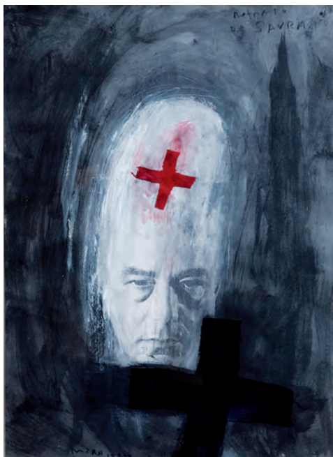
Retrato de Antonio Saura, 1997 Portrait of Antonio Saura Óleo y collage sobre cartón Oil and collage on cardboard Colección IAACC Pablo Serrano

Víctor Mira fue un creador integral, heredero del barroco, de Goya, del surrealismo y coetáneo del neoespressionismo alemán, referencias de las que se nutrió su mirada subjetiva y oníricamente atormentada que le convertiría en uno de los autores más singulares de la plástica española de finales del siglo XX. Derivaba de ella un personalísimo imaginario poblado de estilitas, cruces y crucifixiones, cráneos y naturalezas muertas que plasmó en su obra pictórica, escultórica, gráfica, cerámica, de cartelismo, escenografía y producción literaria. A través de estos múltiples terrenos creativos, Mira nos enfrentó a su propio universo marcado por la visión desencantada, cruel y escatológica de una realidad con la que el autor se encontraba en constante lucha.