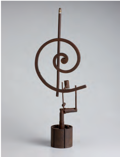
Espiral , 1957

(Crivillén [Teruel], 1908 - Madrid, 1985)