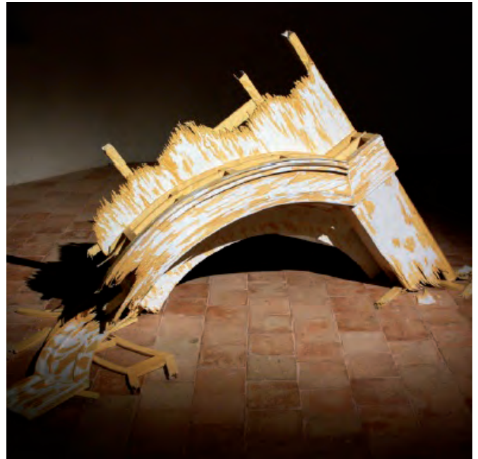
La dernière lueur , 2016