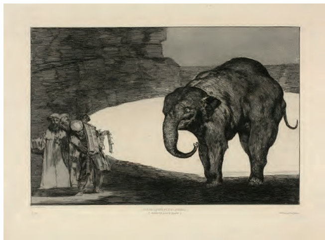
Disparate de bestia , 1877

(Fuendetodos [Zaragoza], 1746 - Burdeos, 1828)