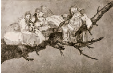
Francisco de GOYA Disparate nº 3. Disparate ridículo , 1864 (1ª edición) Follies / Irrationalities nº 3. Ridiculous Folly Aguafuerte, aguainta, bruñidor y punta seca Etching, aquatint, burnisher drypoint Colección Museo de Zaragoza