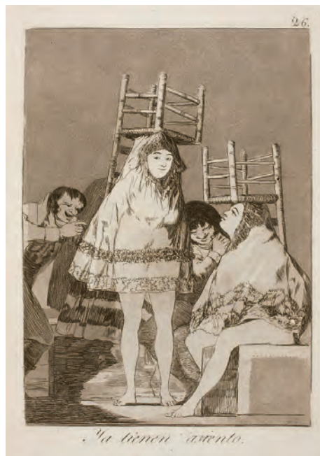
Capricho nº 26. Ya tienen asiento , 1937 (12ª edición)

Plate 26 from Caprichos. They've already got a seat