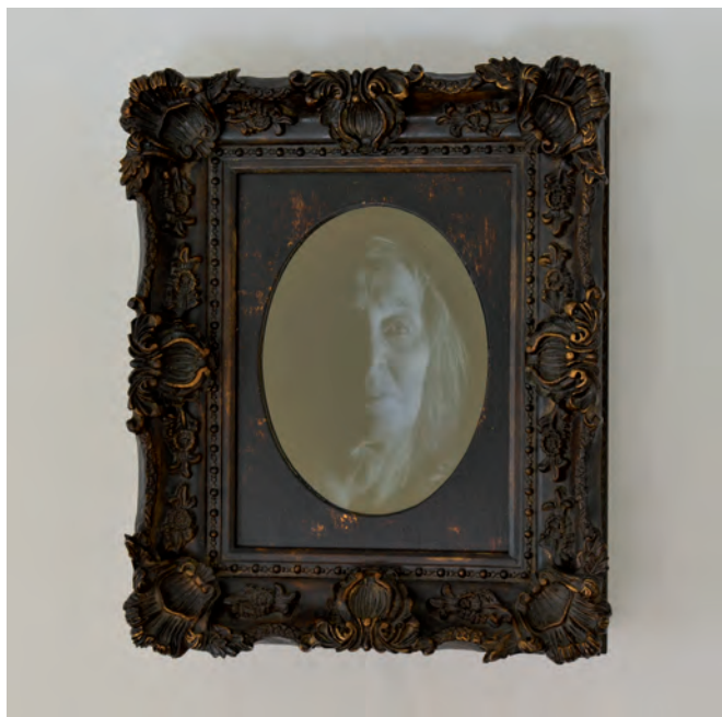
Serie Dogmatic Lullaby , 2013 Poliéster, sistema electrónico, espejo, cristal y madera Polyester Print, electronic, mirror, glass and wood Colección de los autores