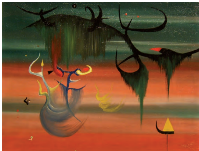
El cortejo nupcial , 1950 Bridal party Óleo sobre lienzo Oil on canvas Colección IAACC Pablo Serrano

Tras sus inicios surrealistas y su paso por París, Antonio Saura, uno de los fundadores de El Paso, se convertía a finales de los 50 en uno de los grandes representantes de la pintura informalista española con un fulgurante reconocimiento internacional que le valdría en 1960 el Premio Guggenheim. Influidor por Goya y el Barroco español, Saura cultivó una pintura de acento expresionista que se traduciría en su intensa gestualidad, obtenida a través de la pincelada suelta, el dripping o el grattage, así como en la crudeza de sus representaciones, violentas, deformes, desgarradas e irónicas, plasmadas en series como las Crucifixiones , Multitudes o Cocktail Party .