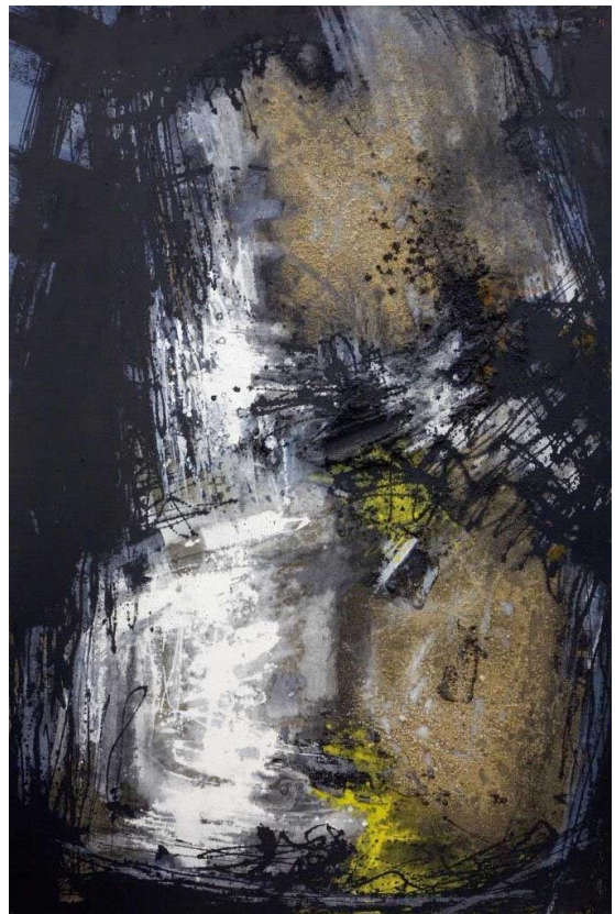
Sin título, 1958 Técnica mixta sobre lienzo, 197 x 132 cm