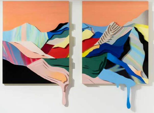
Encuentro , 2025 Acrílico y metacrilato sobre madera 140×70 cm (diptico)