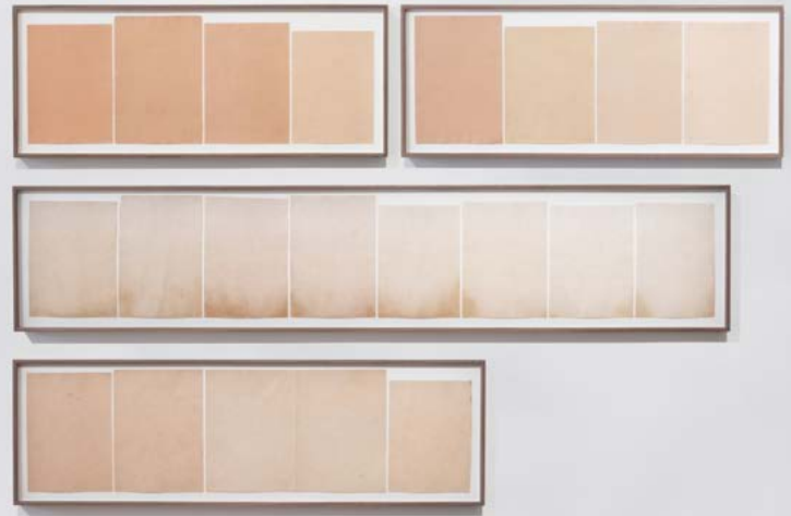
Windowsill , London, 2020 Alfèizar , Zaragoza, 2020 Fensterbank , Berlin, 2024 Registro de intemperie sobre papel secante Dimensiones variables