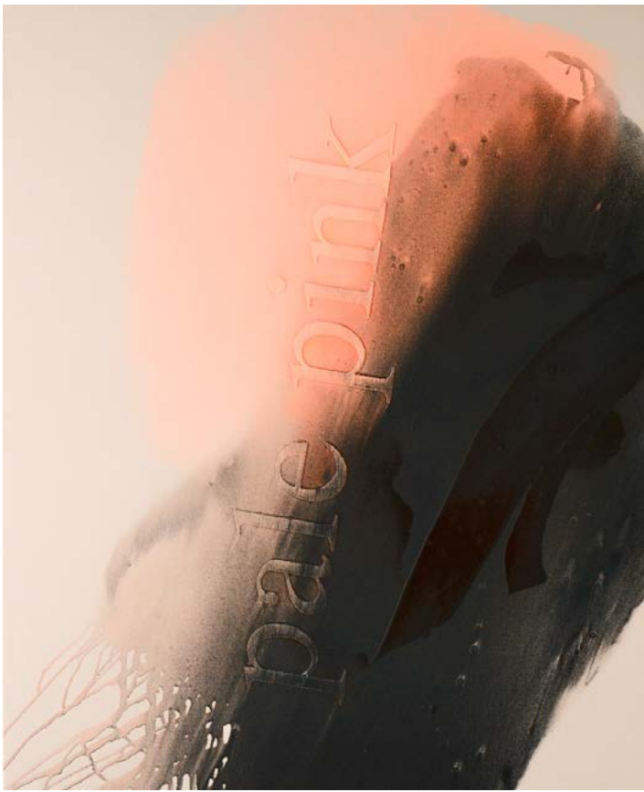
Pale Pink , 2025 Pigmento de hierro, acrílico y bordado sobre lienzo 110·90 cm