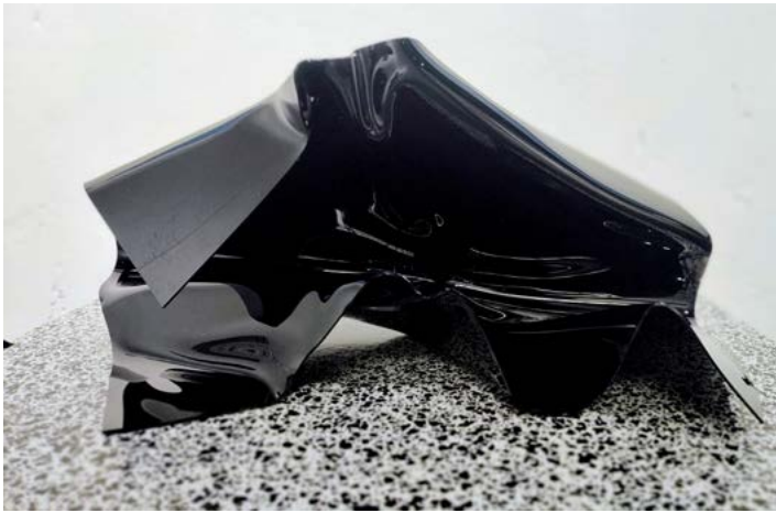
Elogio a la sombra , 2026 Metacrilato de colada negro plegado 27×60×52 cm