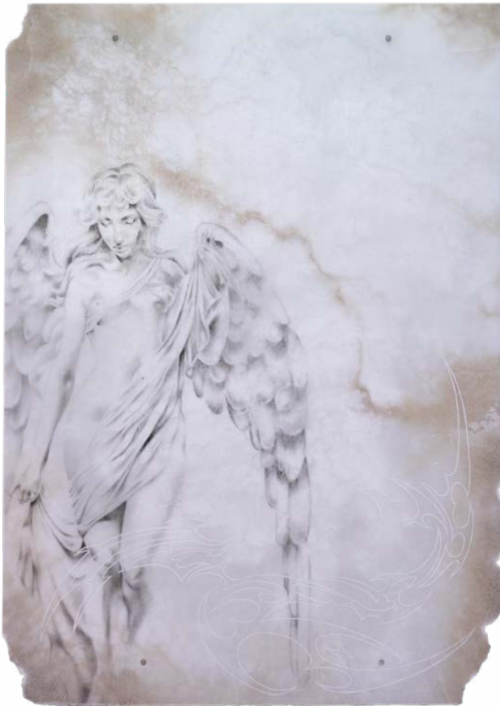
Némesis , 2025 Óleo y talla sobre alabastro 50×80 cm