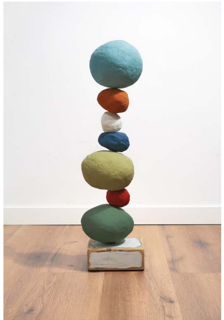
Equilibrio 2 , 2025 Mortero y pintura de exterior 82 cm

Asun Valet desarrolla una práctica centrada en la pintura como estructura, materia y tensión interna. Sus obras exploran la relación entre pigmento, vacío, equilibrio y densidad, construyendo superficies de gran intensidad contenida. En diálogo con Juana Francés, su trabajo subraya la continuidad de una sensibilidad material que encuentra en la pintura un espacio de resistencia y depuración.